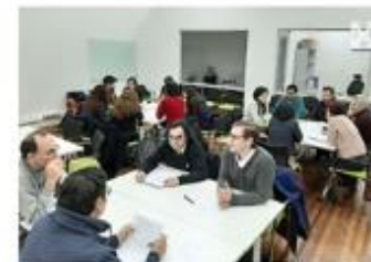
Profesoras y profesores coordinadoras en jornada: Aprendizajes y desafíos de la coordinación docente en el primer año universitario